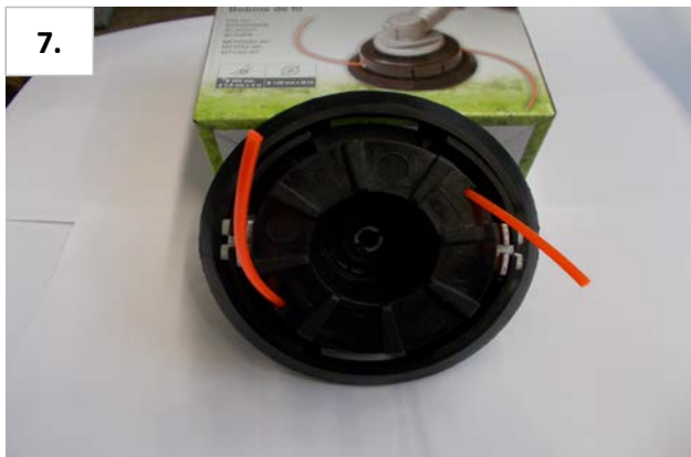
7. Fadenspule in Spulenkopf stecken.