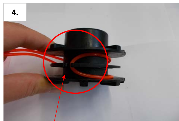
4. Nylonfaden Ø 2,8mm x 4m in zwei gleiche Längen mit Schlaufe in den Schlitz einlegen.