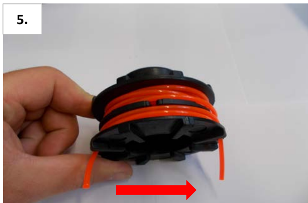
5. Beide Faden auf Spule wickeln (siehe Pfeilrichtung auf Spule).