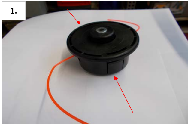
1. Laschen siehe Pfeile zusammendrücken.