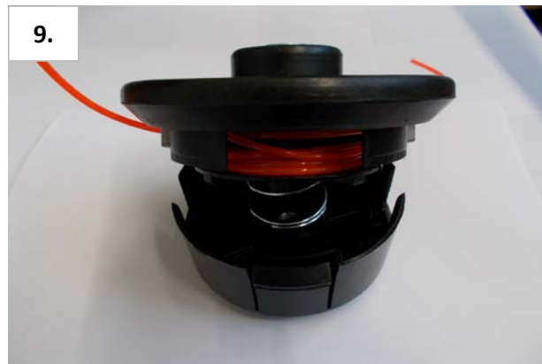
9. Deckel mit Spulenkopf zusammenstecken. Fertig.