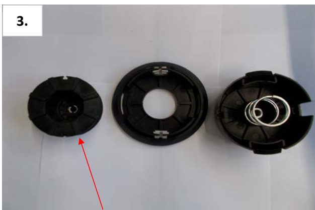
3. Fadenspule entnehmen.