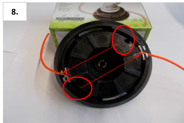
8. Faden aus den arretierungen der Spule nehmen, und entgegengesetzt in die Öffnungen des Spulenkopfes stecken (Siehe Bild 8).